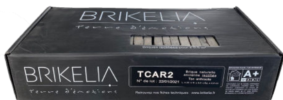
Boîte de 0.5 m 2 Brique Vintage La rectifiée