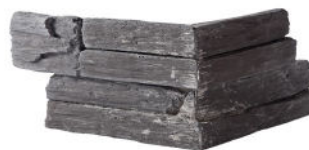
Angle L. 41 x l. 21 x h. 18 Épaisseur 3 cm