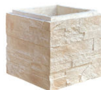
Élément boisseau PORTLAND L. 37 x l. 37 x H. 33 cm